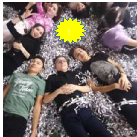
8Г ВМЕСТЕ в «Форд Боярд»!