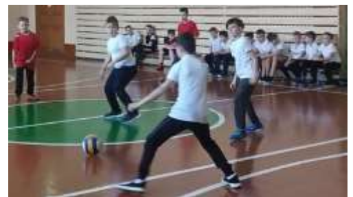
Запасные ждут замены...

27 марта прошли соревнования на Кубок гимназии по мини-футболу среди команд мальчиков и девочек, обучающихся 3-х классов. Соревнования проходили ярко и динамично. Энергия болельщиков, в числе которых были одноклассники, учителя и их родители, наполняла футбольный дух ребят. Победители и призеры соревнований были награждены кубками и грамотами.