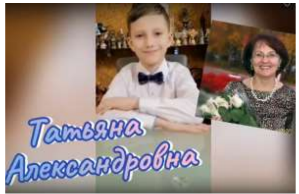
3Г Поздравил своих мам и любимую учительницу!